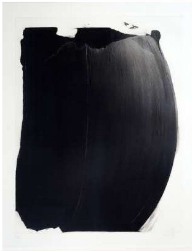
Christiane Vielle En guise de Eau-forte 76 x 56 cm 1988