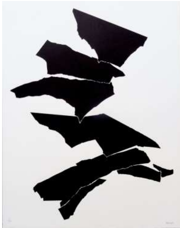
Penalba Alicia Sérigraphie 74 x 54 cm 1977