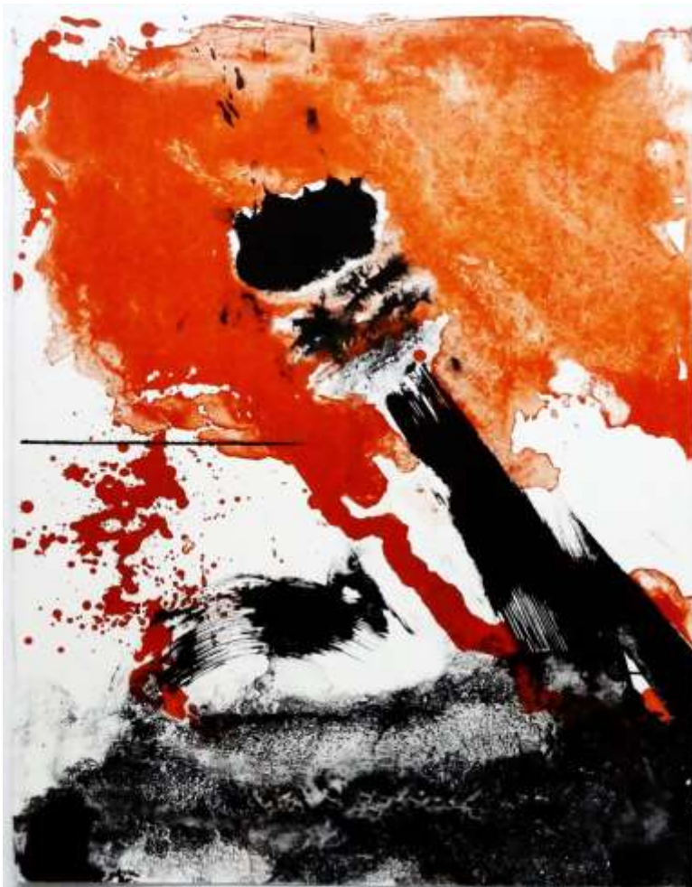
Serge Saunière Vive la couleur Lithographie 65 x 50 cm 1977 Atelier Pousse Caillou