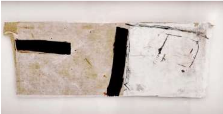
Jean-Louis Espilit Sans Titre Lithographie rehaussée sur papier népalais et marouflée sur jute. 18 x 45 cm 1990